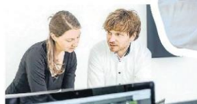
3D-Modelle wie das charakteristische T der Technologiewerkstatt werden in Schulprojekten hergestellt (Foto links).